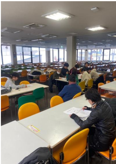
予備原動装置取扱訓練